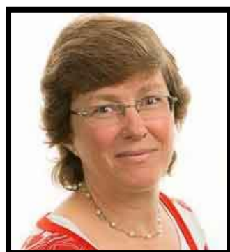
Chantal Turin Préfète du District de Nyon et habitante de Gilly

« La jeunesse c'est des moments de partage, de solidarité, de remises en question parfois mais surtout de belles rencontres et des amitiés qui durent toute une vie ! »